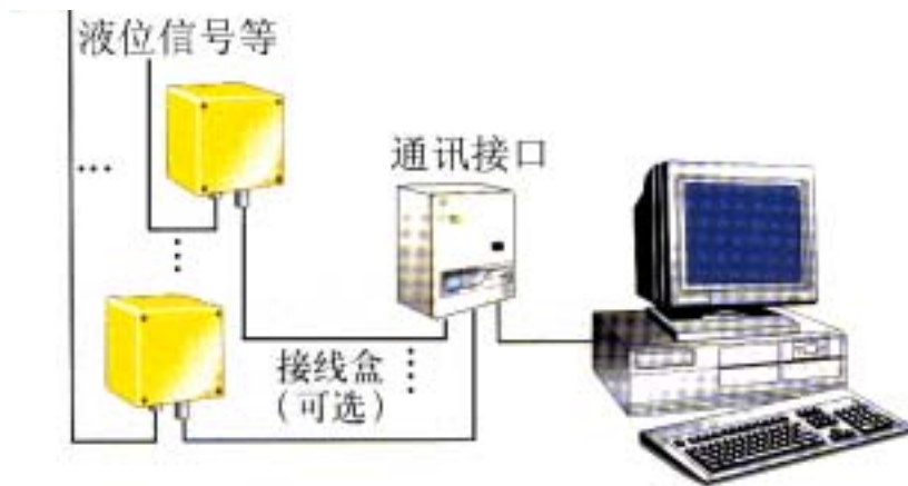
GCS-Y 系统简单构成示意图

本系统具有造价低，连接容易的特点。目前可以在一台计算机上实现 8 路、16 路、32 路及 64 路液位或其它压力，温度等过程量的观测、管理和控制。